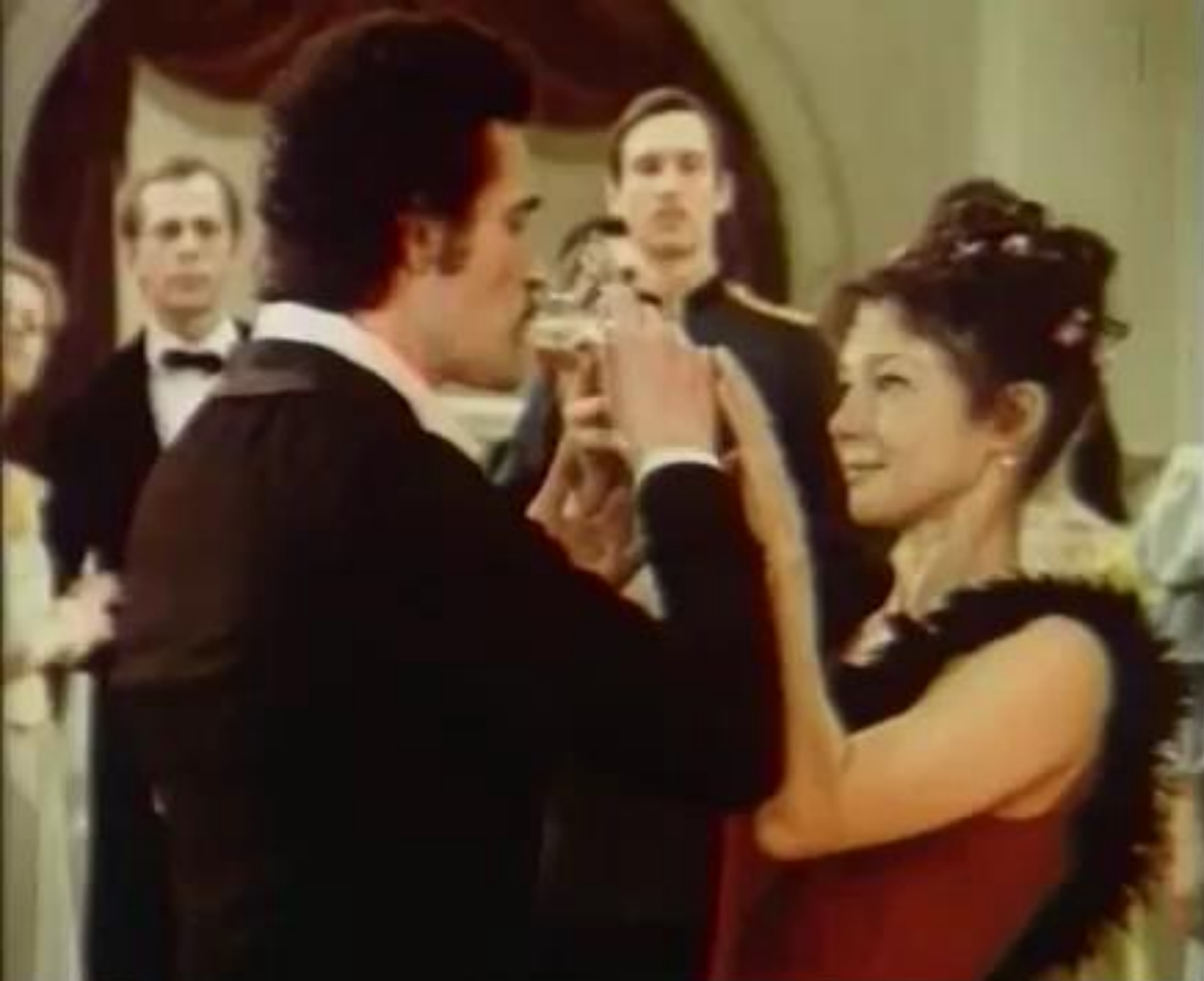
Кадр из фильма-балета — «Тарантелла»