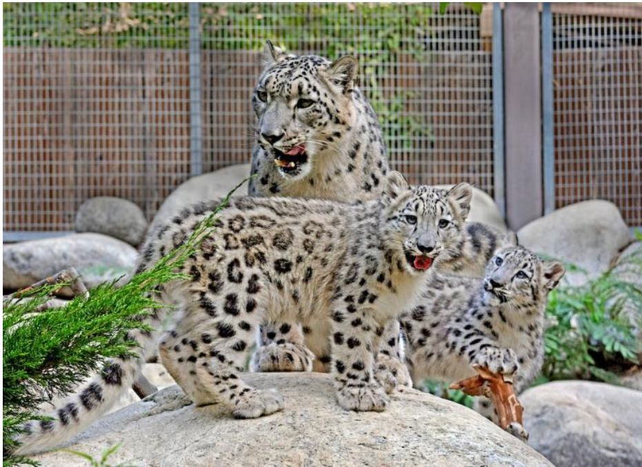
A snow leopard and her one-year-old cubs at Los Angeles Zoo