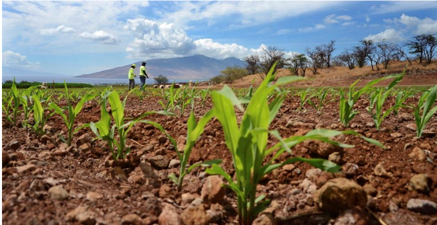
Test hybrid corn sprouts being grown in a nursery near Kihei, Hawaii.