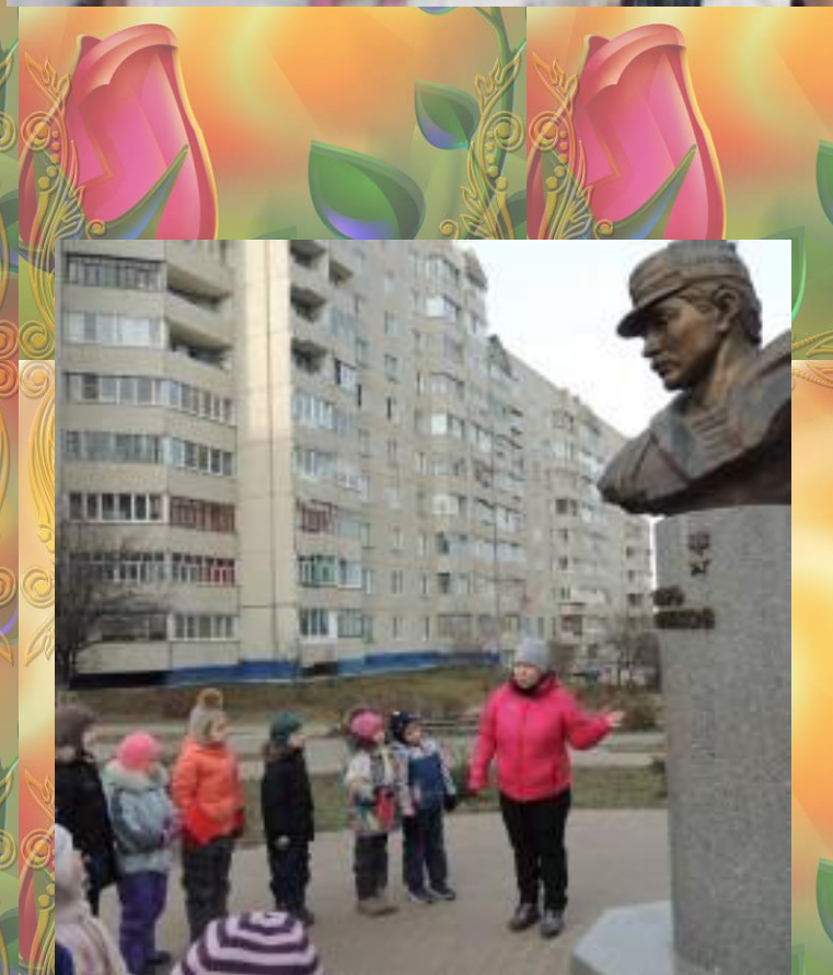
В сквере Героя России - Игоря Петрикова