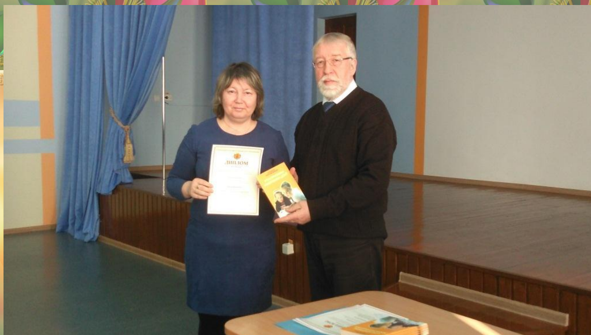
Диплом 2 степени в номинации "Проект по духовно-нравственному гражданско-патриотическому воспитанию".