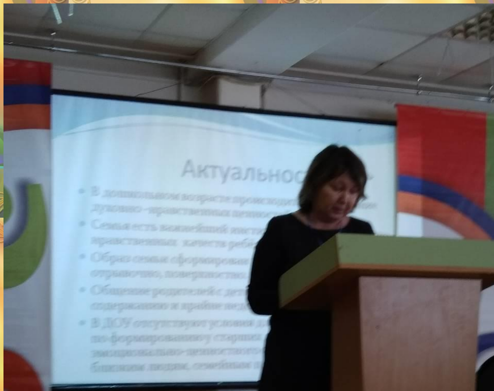
На 6 межрегиональном форуме педагогических работников "Вектор развития - 2018".