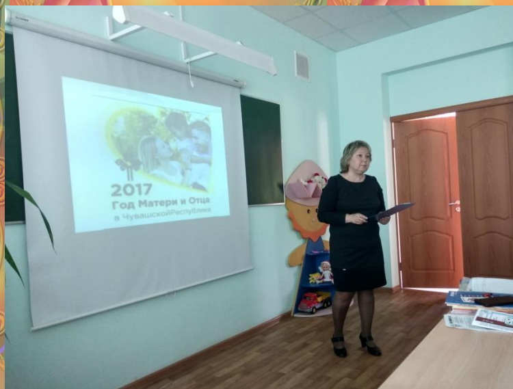
Республиканская научно-практическая педагогическая конференция «Никольские чтения: вызовы современного общества и воспитание человека будущего», посвященная 141-ой годовщине со дня рождения Н.В. Никольского - май, 2019 год