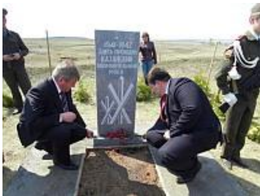
Рис. 7. Открытие обелиска

В Мариинско-Посадском районе Чувашии началось сооружение