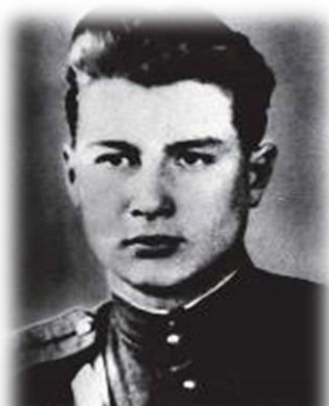
Рис. 3. А.Я. Эшпай

«Ломом глину мы рубили, ум-па-ра-ра. На носилках мы носили.... Правда? Да-да! Очень трудно было нам! ум-па-ра-ра. Все делили пополам. Правда? Да-да!».