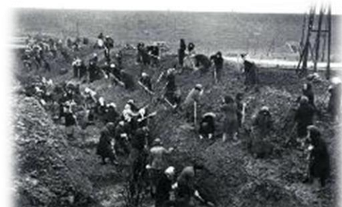
Рис.2. Строительство Казанского рубежа

Мобилизованное население объединялось в рабочие бригады по 50 человек, которые размещались в окружающих селениях, бараках. Колхозы должны были организовать поставку продуктов и фуража, врачебные участки – необходимыми медикаментами. Было организовано два Военно-полевых сооружений (ВПС), на Казанском направлении: с. Октябрьское и с. Янтиково. Постановлением особого