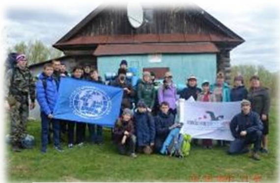
Рис. 4. Участники экспедиции

I экспедиция «Историко-географическое исследование оборонного сооружения «Казанский Рубеж» на территории Чувашии». В период с 6 по 8 мая 2015 г. Чувашское республиканское отделение Русского географического общества и историко-географический факультет Чувашского государственного университета им. И.Н. Ульянова провели пешую экспедицию «Историко-географическое исследование оборонного сооружения «Казанский Рубеж» на территории Чувашии». Маршрут экспедиции, посвященной 70-летию Победы в Великой Отечественной войне и 170-летию со дня создания Русского географического общества, проходил по территории Мариинско-Посадского, Козловского, Урмарского и Янтиковского районов Чувашии. Целью экспедиции стало историко-географическое исследование современного состояния оборонного сооружения времен Великой Отечественной войны «Казанский Рубеж» на территории Чувашии, его инвентаризация, глазомерная съемка и картографирование.