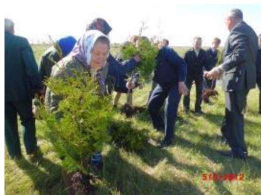
Рис. 8. Посадка памятной аллеи

В селе Покровское Мариинско-Посадского района заложена аллея в честь тех, кто возводил оборонительные укрепления в годы Великой Отечественной войны 1941-1945 гг. Памятные знаки – напоминание молодому поколению об этом грозном времени. Спасибо, дорогие труженики тыла, за Ваш героический труд! Так завершилась эта трудовая эпопея. Пусть теперь говорят, что негодились эти сооружения. Слава Богу, что негодились! Зато мы знаем, на что способен наш народ в трудную годину.