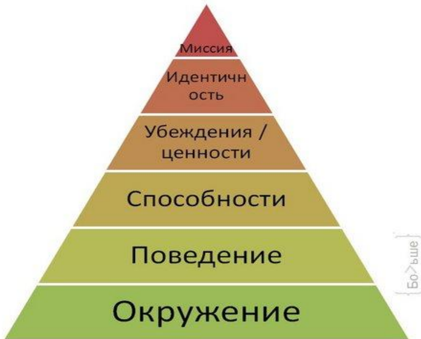
Пирамида Дилтса (модель логических уровней)